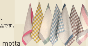
motta 自社ハンカチブランドの商品です。1925年パリ万博に自社からハンカチを出品した歴史があります。